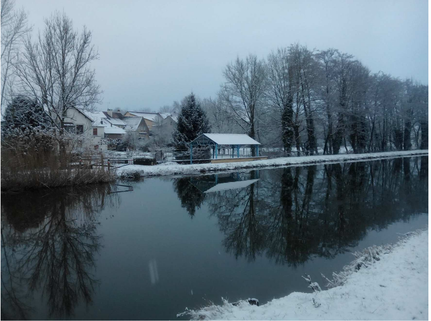
IMAGE de NOTRE VILLAGE