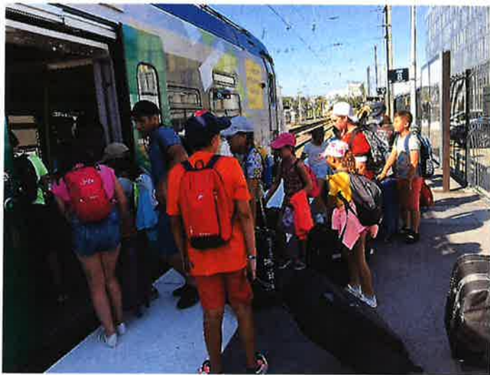
Classe verte à Morteau pour les CE2-CM ... Un voyage très attendu avec départ en train