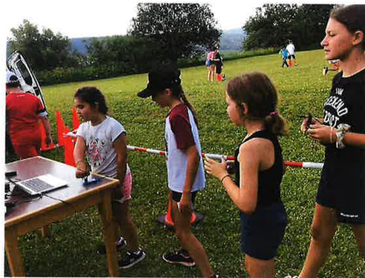
Des activités nouvelles et variées : Visite du Saut du Doubs, mais il n'y avait que le saut, pas l'eau ... Musée de l'horlogerie, Accrobranche, Initiation à la course d'orientation, Randonnée...