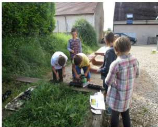
Un essai de jardinage, à reconduire...