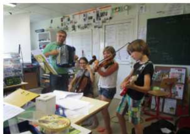
21 juin, la fête de la musique en classe.