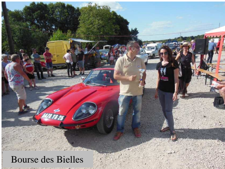
Bourse des Bielles