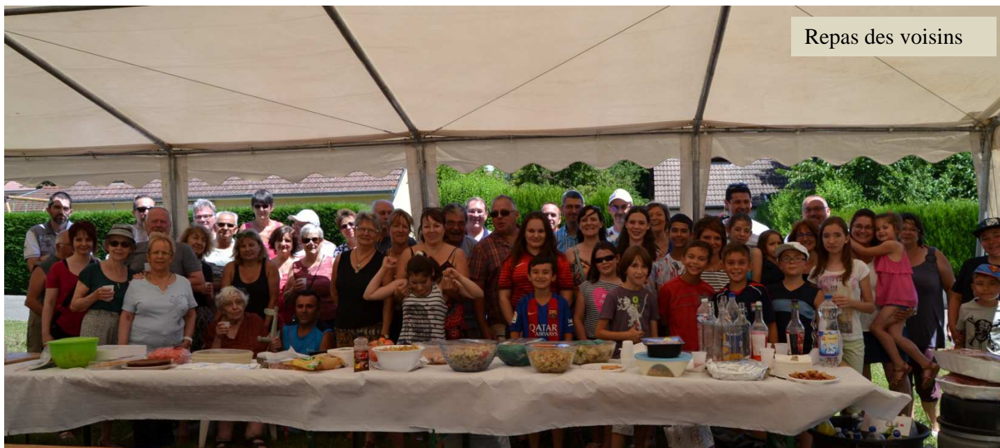
Repas des voisins