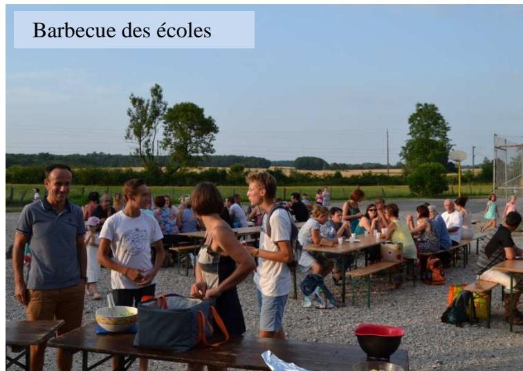
Barbecue des écoles