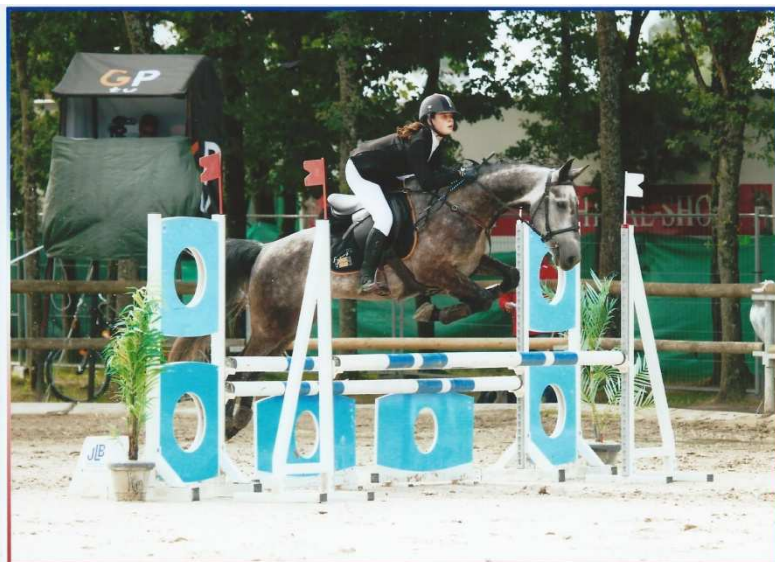
CHAMPIONNAT DE FRANCE LAMOTTE BEUVRON 2017

Elle a également participé à l'épreuve par équipe. Son équipe a pris la 5 e place sur 45 équipes et s'est qualifiée pour la finale regroupant les 10 meilleures équipes. Après les 2 premières manches, elle est classée à la 1 ère place provisoire avec des parcours sans faute et le meilleur chrono.