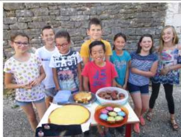
Au revoir les CM2...