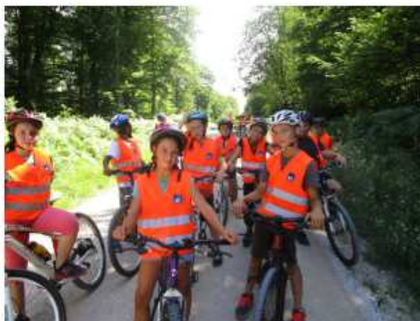
Une sortie vélo en forêt de Chaux.