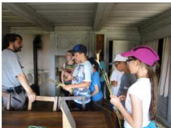
Une journée au musée des maisons comtoises à Nancray.