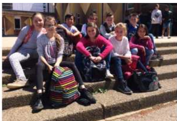
Une matinée passée au collège pour les futurs 6èmes.