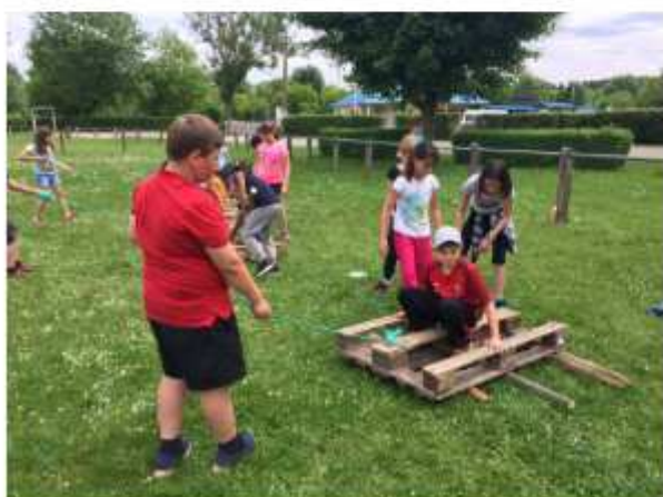
Une rencontre sportive à Brevans, une à Goux, une à Parcey.