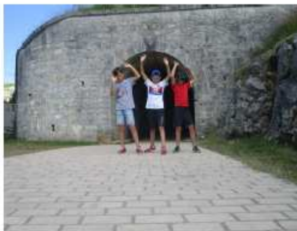
Les gagnants du concours photo: il fallait soutenir la voute qui allait tomber...